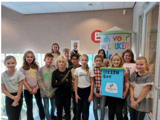
Leerlingenraad en staatssecretarissen